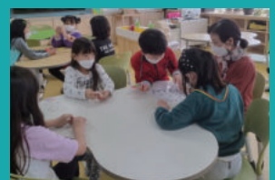
대한민국 최고 돌봄