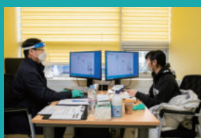
진학률을 높이는 경남대입정보센터