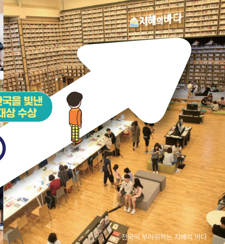
전국이 부러워하는 지혜의 바다